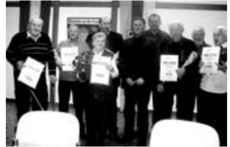
Ehrung langjähriger Mitglieder bei der Jahreshauptversammlung

Der Obmann bedankte sich nochmals bei den Geehrten für die lange Treue zum PVÖ. Ein großes Dankeschön gab es auch für die beiden Bürgermeister der Gemeinden Feistritz/Gail und Hohenthurn für die Unterstützungen durch die Gemeinden, und für die unentgeltliche Bereitstellung der Räumlichkeiten bei den Veranstaltungen.