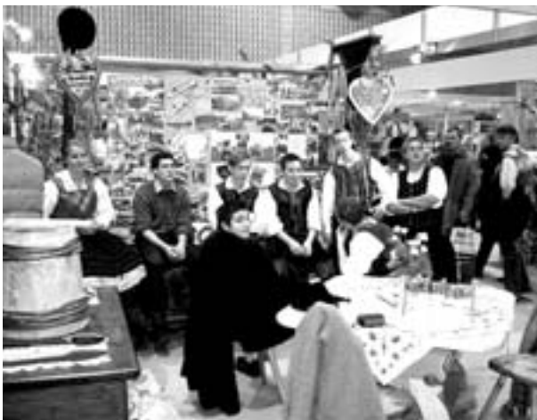
Die Burschen und Mädchen bei ihrem Stand

tagsfotos, welche von der gesamten Dorfbevölkerung zur Verfügung gestellt worden sind. Mittels originalen Ausstellungsstücken, wie z.B. „Schlegel“, „Kranzl“, „Fassl“ usw. und einer Videovorführung des Kufenstechens auf der Leinwand mittels Beamer wurde der Kirchtag den Besuchern näher gebracht. Nach diesem interessanten sowie anstrengenden Wochenende bereitet sich nun die Burschenschaft wieder auf die neuen Aufgaben und Herausforderungen vor.