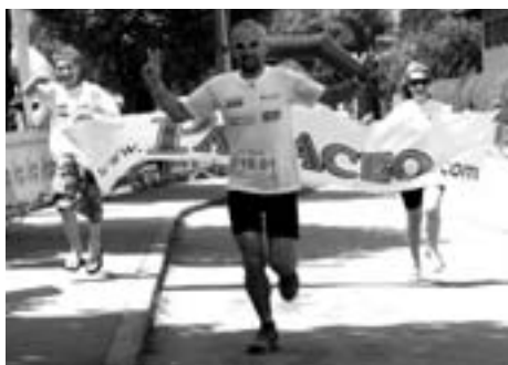
Unser Briefträger beim Endspurt bei der WM in Moosburg