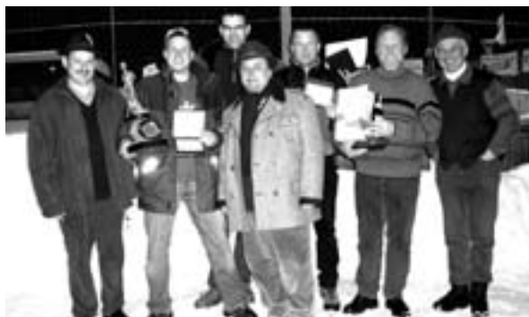
Am 28. Jänner 2006 fand das 1. Hegeringeisstockturnier statt.

Die Jäger des Hegerings 25 wechselten die Waffe mit dem Eisstock und beschos-