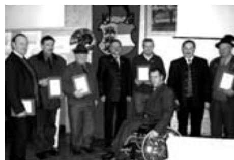
die geehrten Mitglieder des Hegerings 25

Der Vormittag war den Schülern der Volksschule Thörl-Maglern gewidmet. Die Jäger des Hegerings stellten den Schülern in mehreren Stationen das heimische Wild mit Jagdbrauchtum, Naturschutz und Jagdhundewesen vor. Neben den Trophäen waren auch Präparate des heimischen Wildes ausgestellt. Die diesjährige Hegereschau war eine beeindruckende Veranstaltung für Groß und Klein.