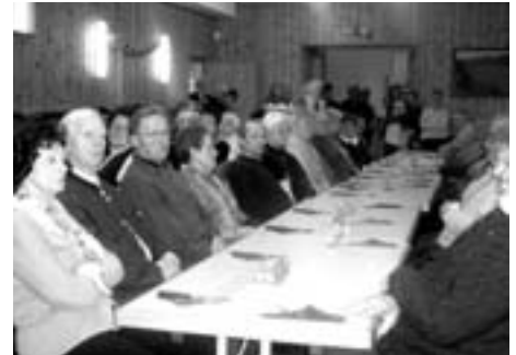
vollbesetzter Kultursaal Feistritz/Gail

Abschließend bedankte sich der Vorsitzende bei allen Mitgliedern, dass sie so zahlreich bei den Veranstaltungen teilnehmen, und er betonte, dass dadurch die Bemühungen des gesamten Ausschusses belohnt werden. In bester Stimmung und mit dem traditionellen Heringschmaus endete dieser schöne Nachmittag.